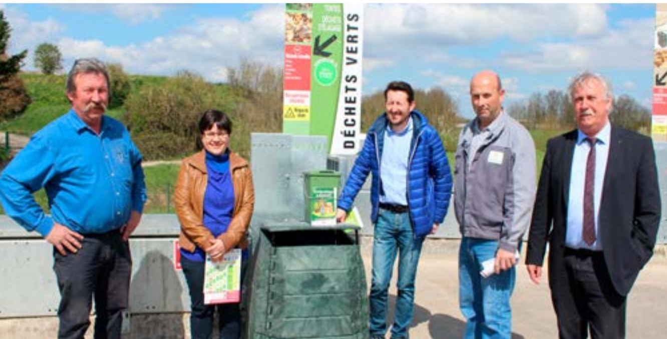
Point presse : sensibilisation au compostage

** Coût aidé : coût du service moins les soutiens financiers et la vente des matériaux.