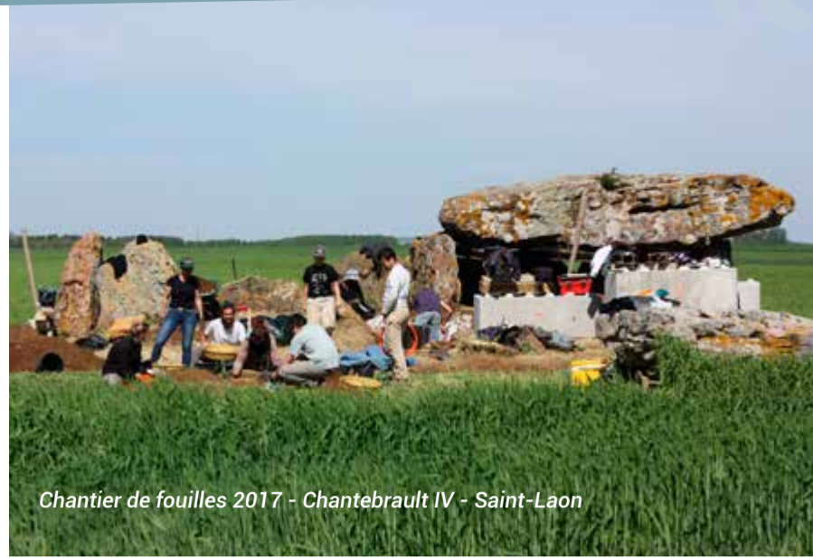
Chantier de fouilles 2017 - Chantebrault IV - Saint-Laon

Le musée Charbonneau-Lassay continue d'offrir des expositions dédiées au Néolithique :