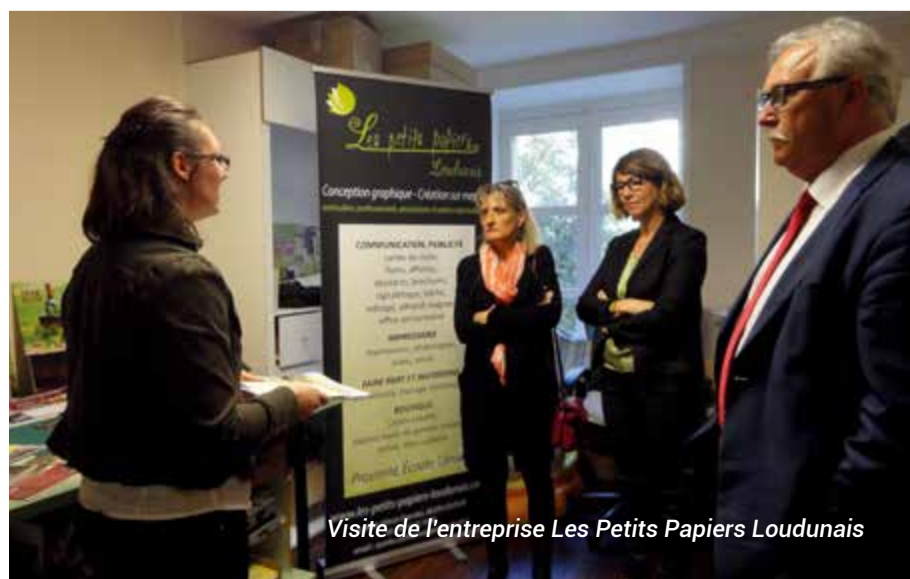
Visite de l'entreprise Les Petits Papiers Loudunais

d'interim, point transport, Armée de l'air et Marine, Gendarmerie, Pôle Emploi, Mission Locale, Chambre de Commerce, Chambre de Métiers, CCPL ainsi que les entreprises qui ne pouvaient pas recevoir de public mais souhaitaient être présentes à cet événement.